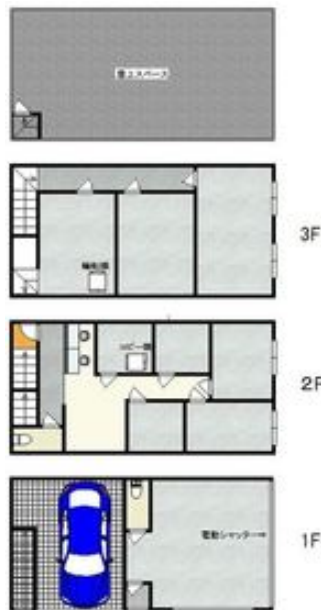
間取写真 図面・設備と現況が異なる場合は現況が優先となります。