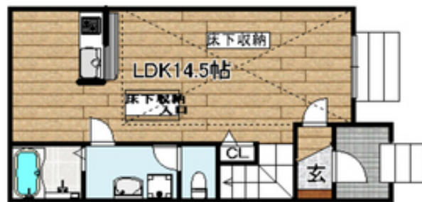
間取写真 図面・設備と現況が異なる場合は現況が優先となります。