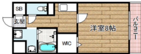
間取写真 図面・設備と現況が異なる場合は現況が優先となります。