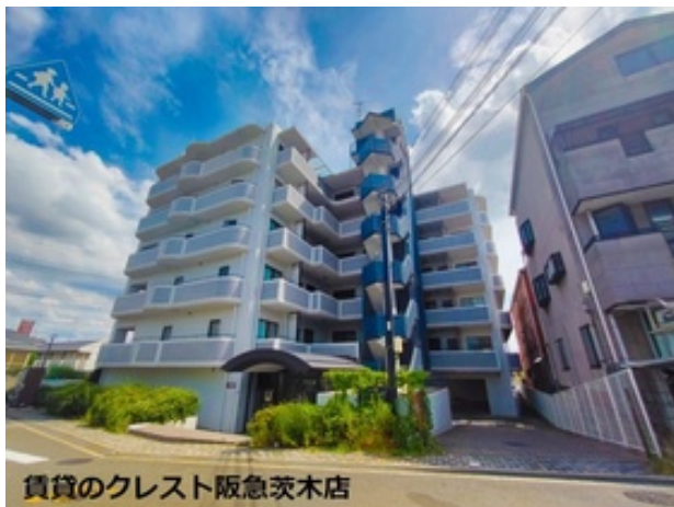
賃貸の Crest 阪急茨木店

LDK広々10帖以上にシステムキッチン完備! 浴室乾燥機・シャワートイレ・洗髪洗面化粧台など設備充実の3LDK