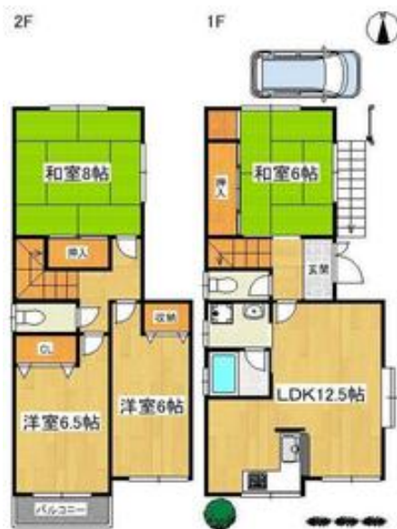
間取写真 図面・設備と現況が異なる場合は現況が優先となります。