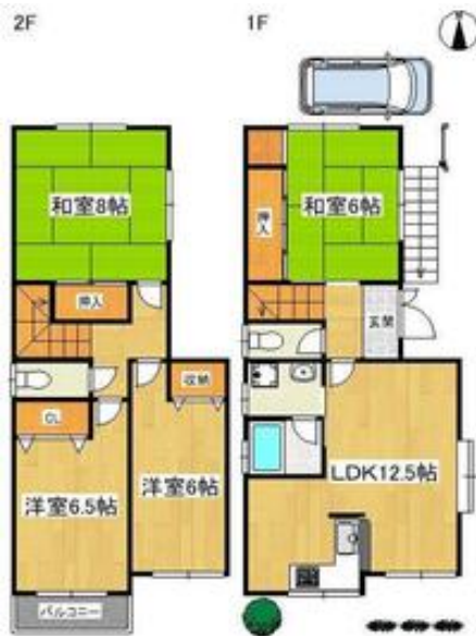
間取写真 図面・設備と現況が異なる場合は現況が優先となります。