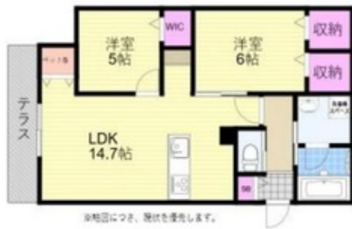
間取写真 図面・設備と現況が異なる場合は現況が優先となります。