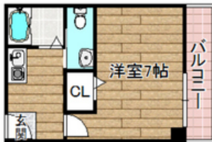
間取写真 図面・設備と現況が異なる場合は現況が優先となります。