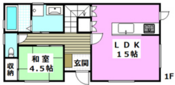
間取写真 図面・設備と現況が異なる場合は現況が優先となります。