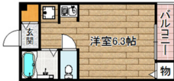
間取写真 図面・設備と現況が異なる場合は現況が優先となります。