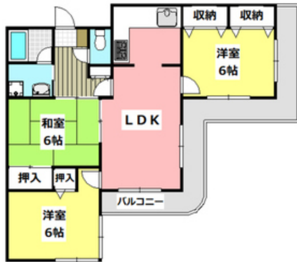
間取写真 図面・設備と現況が異なる場合は現況が優先となります。