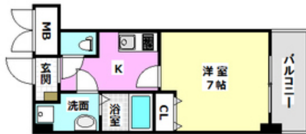
間取写真 図面・設備と現況が異なる場合は現況が優先となります。