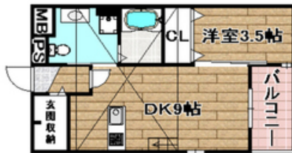
間取写真 図面・設備と現況が異なる場合は現況が優先となります。