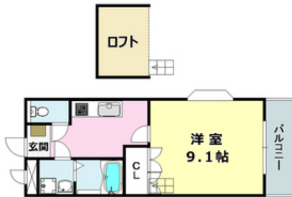
間取写真 図面・設備と現況が異なる場合は現況が優先となります。