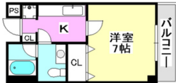
間取写真 図面・設備と現況が異なる場合は現況が優先となります。