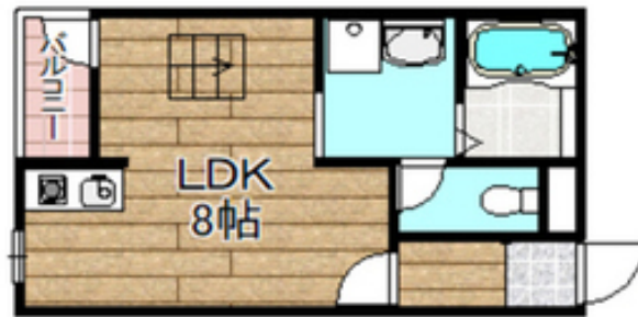
間取写真 図面・設備と現況が異なる場合は現況が優先となります。