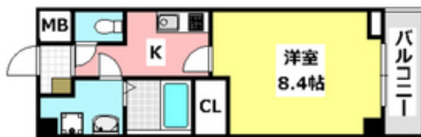
間取写真 図面・設備と現況が異なる場合は現況が優先となります。