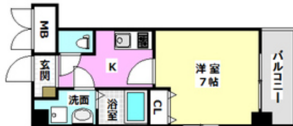
間取写真 図面・設備と現況が異なる場合は現況が優先となります。