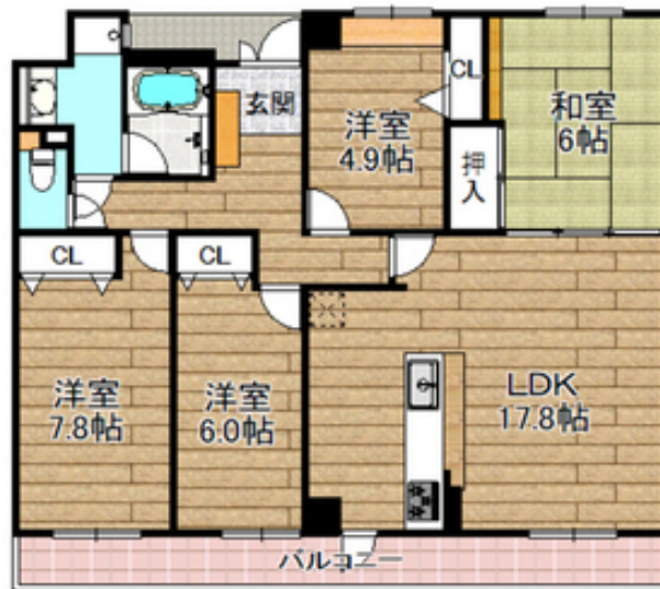
間取写真 図面・設備と現況が異なる場合は現況が優先となります。