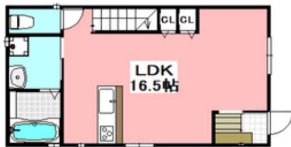
間取写真 図面・設備と現況が異なる場合は現況が優先となります。