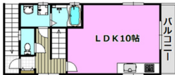
間取写真 図面・設備と現況が異なる場合は現況が優先となります。